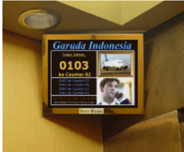
Display / Monitor di dinding