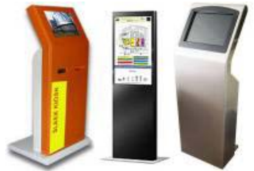
Touch Screen + Kiosk