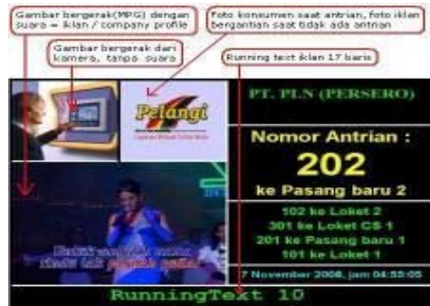
Tampilan di Layar Monitor